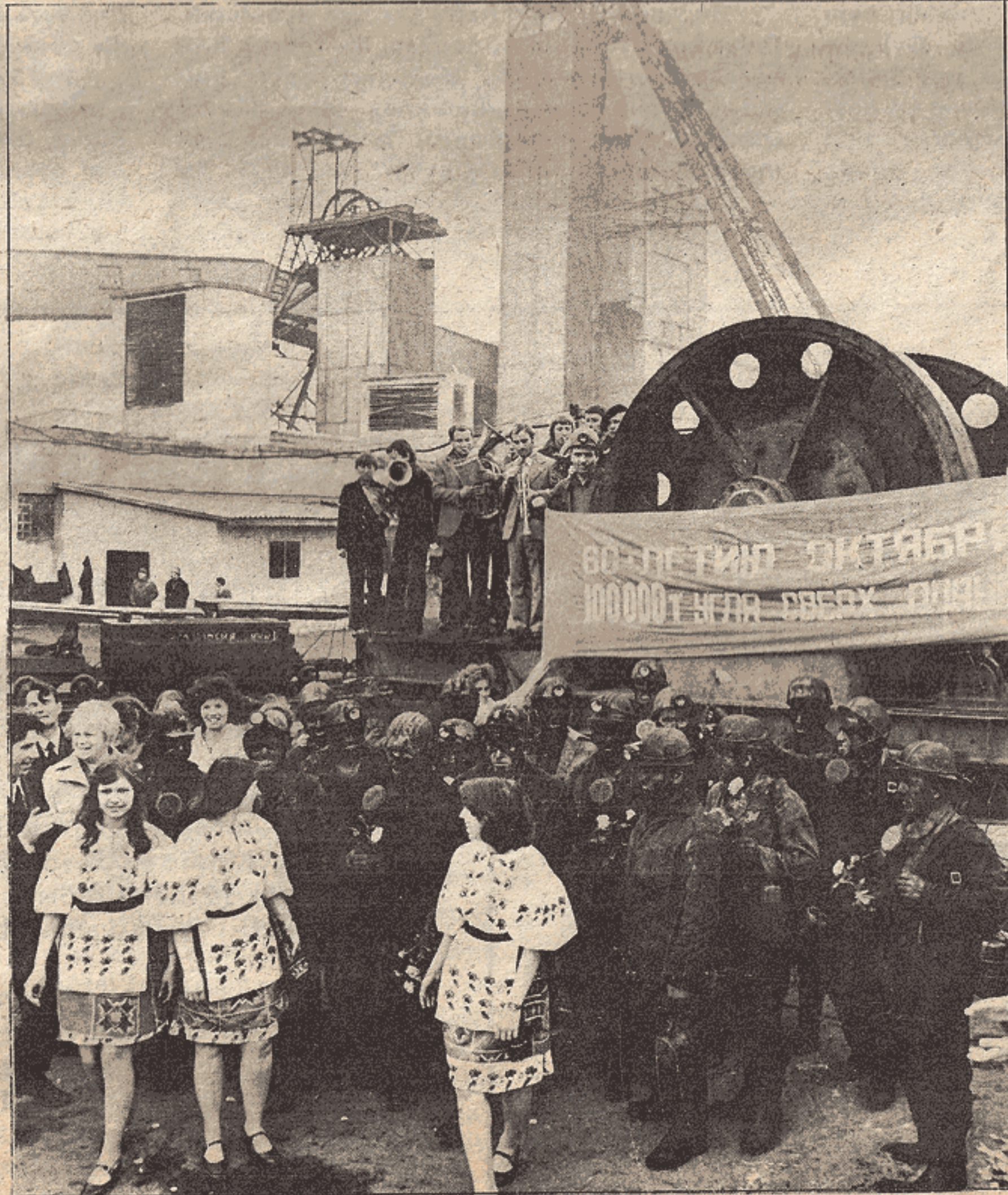
Bir kömür madeni işletmesi. Ekim Devriminin 60. yıldönümü için plânlanan 100.000 TL. üretimin üzerine ulaşmıştır...

Ekim devriminin 61. yılında Sovyetler Birliği işçi sınıfı, ileri, özgür barışçı yeni dünyanın kuruluşunda omuzuna düşen büyük görevi başarıyla sürdürüyor.