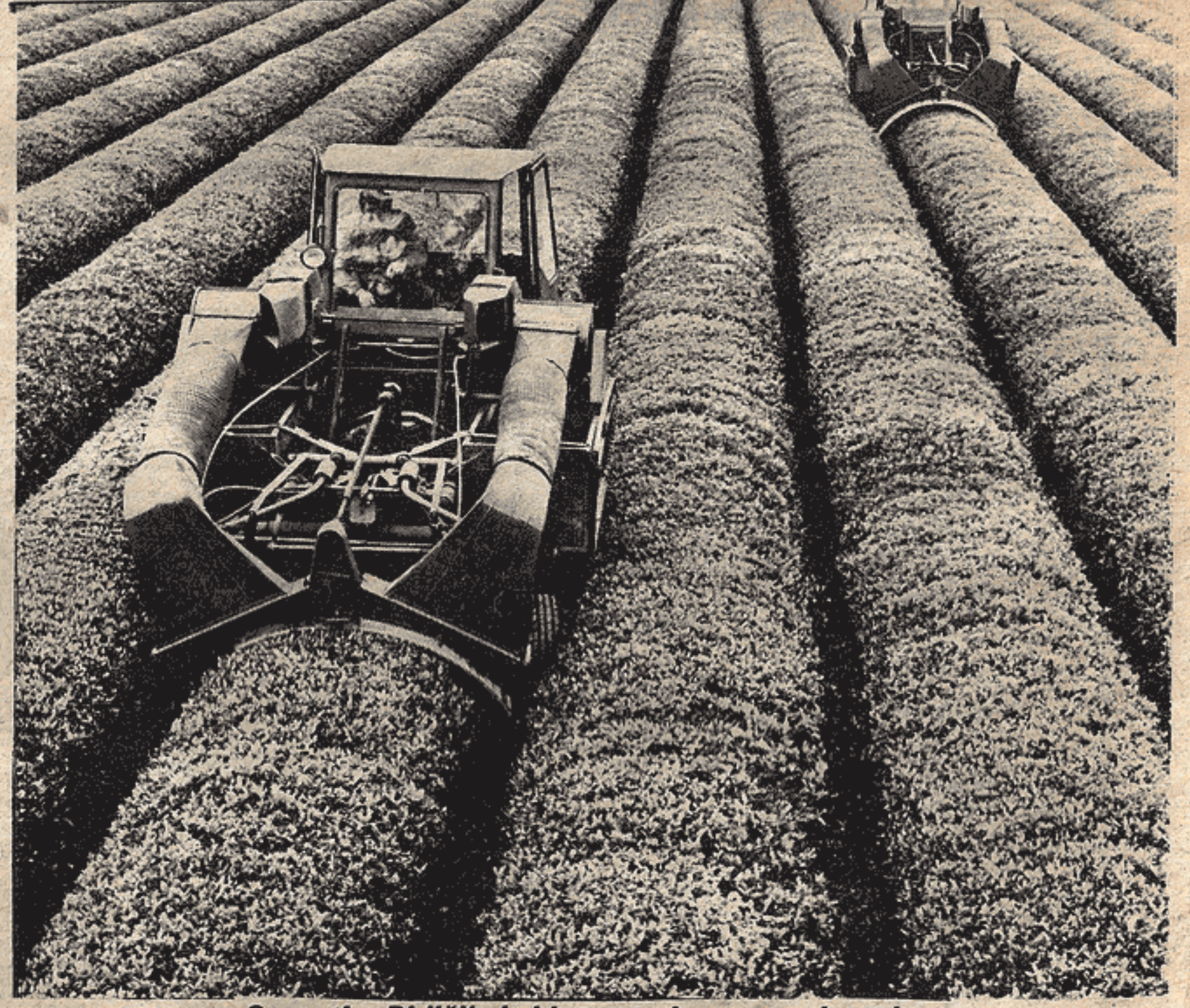
Sovyetler Birliği'nde bir çay tarlası ve çay hasadı...

Görüldüğü gibi 25 yıl içinde ulusal gelir yedi kat artarken, bazı sektörlerdeki büyüme 11 katı aşmıştır.