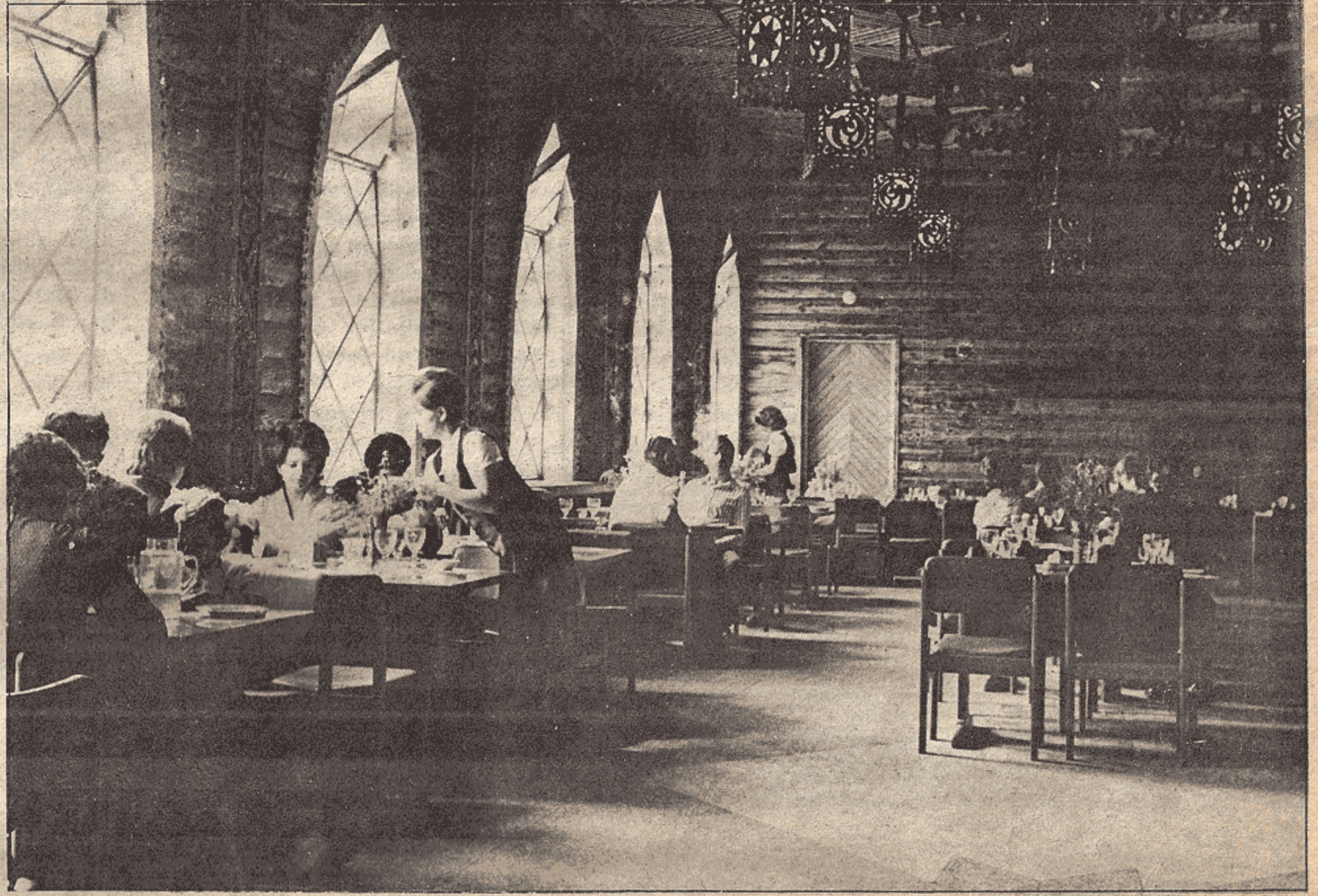
Bir köy lokantası... Sosyalizmde herşey insan için...

Sosyalizm düşmanları, sosyalist ülkelerde "kişinin devlete çalıştığını" söyleyerek saçmalar ve halkın yoksul olduğu biçiminde yalanlara başvururlar. Bir kez sosyalist ülkelerde devlet bir