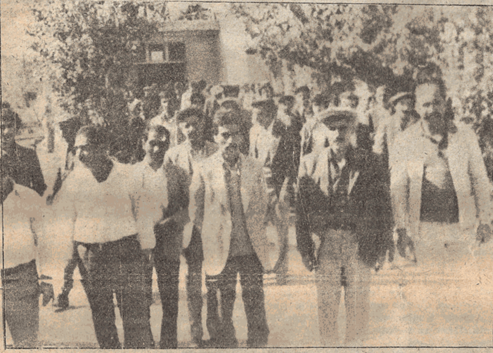
Kongre gününden bir görüntü...

Genel-İş Sendikası Diyarbakır şube kongresi, 14 Ekim 1978 tarihinde Diyarbakır TÖB-DER salonunda yapıldı. Kongreye 224 delege katıldı. Divan başkanlığına GENEL-İŞ Sendikası Genel Sekreteri Ertan Andaş seçildi. Kongreyi çok sayıda demokratik kitle örgütleri temsilcileri ve konuklar izledi.