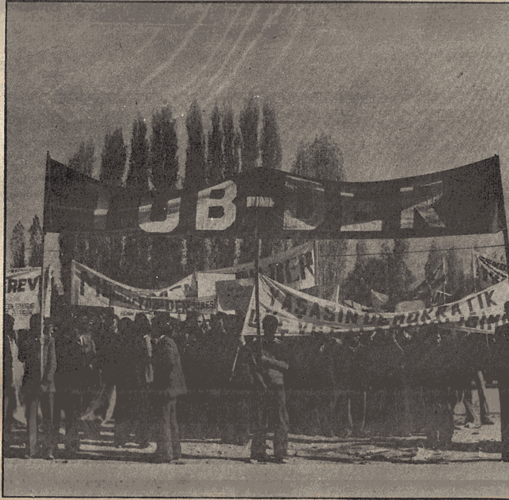
TÖB-DER mitinglerinden biri...

dirmektedir. Grevli toplu sözleşmeli sendika hakkı konusundaki mücadelemizi yok edecek, derneksel işlevlerimizi ortadan kaldıracak bu anti-demokratik yasa tasarılarının yasalasmaması için