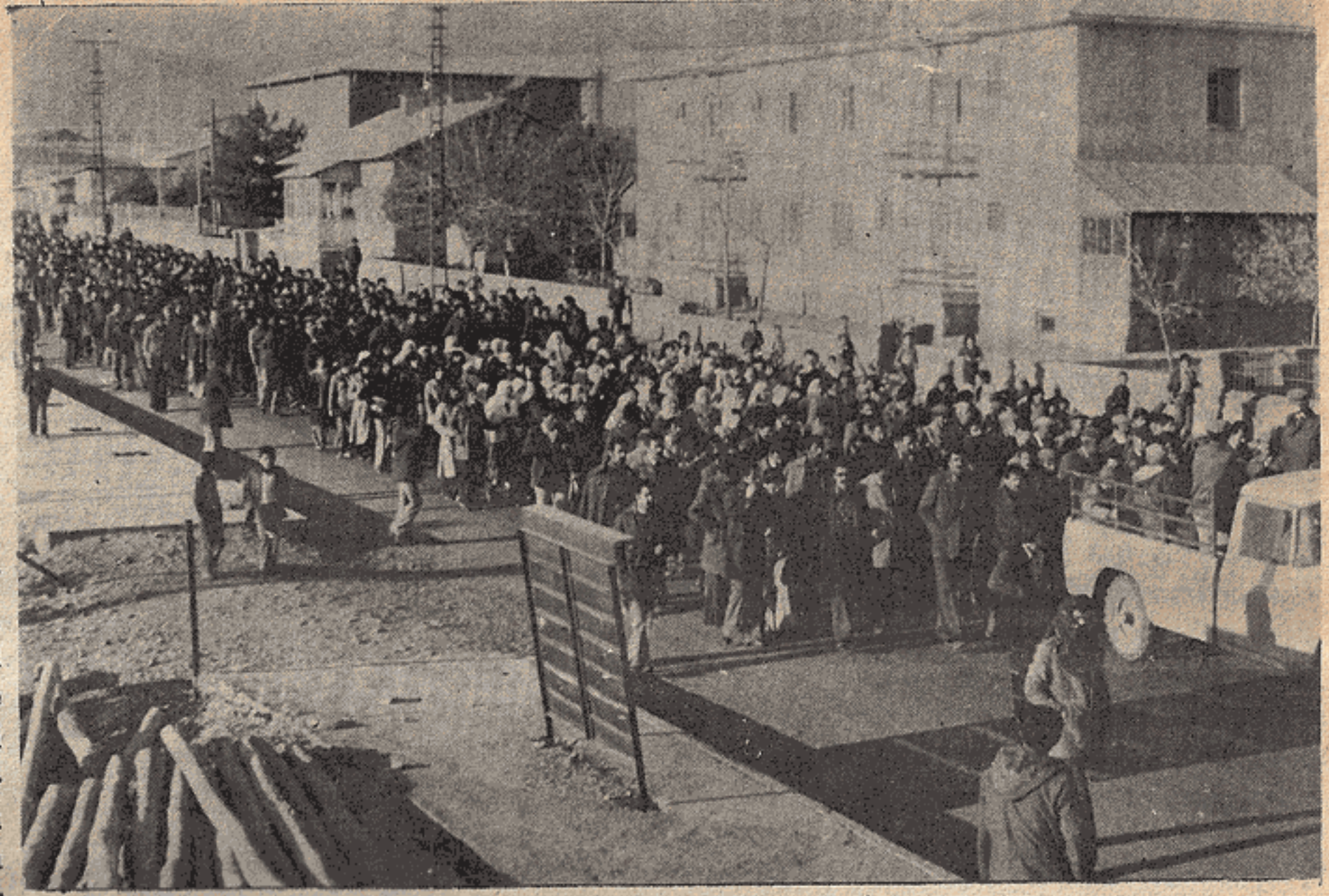
Hasan Sevin'in cenaze törenine beş binin üzerinde bir halk kütlesi katıldı...

Kalabalık yürüyüş boyunca hep bir ağızdan "Kahrolsun Faşizm" sloganını haykırdı. Lise caddesinde yapılan saygı duruşundan sonra öldürülen Hasan Sevin'in oğlu babasının faşistler tarafından öldürüldüğünü, meselelerin Alevi-Sünni meselesi olmadığını kavganın ezilenlerle - ezenler arasında verilen bir kavga