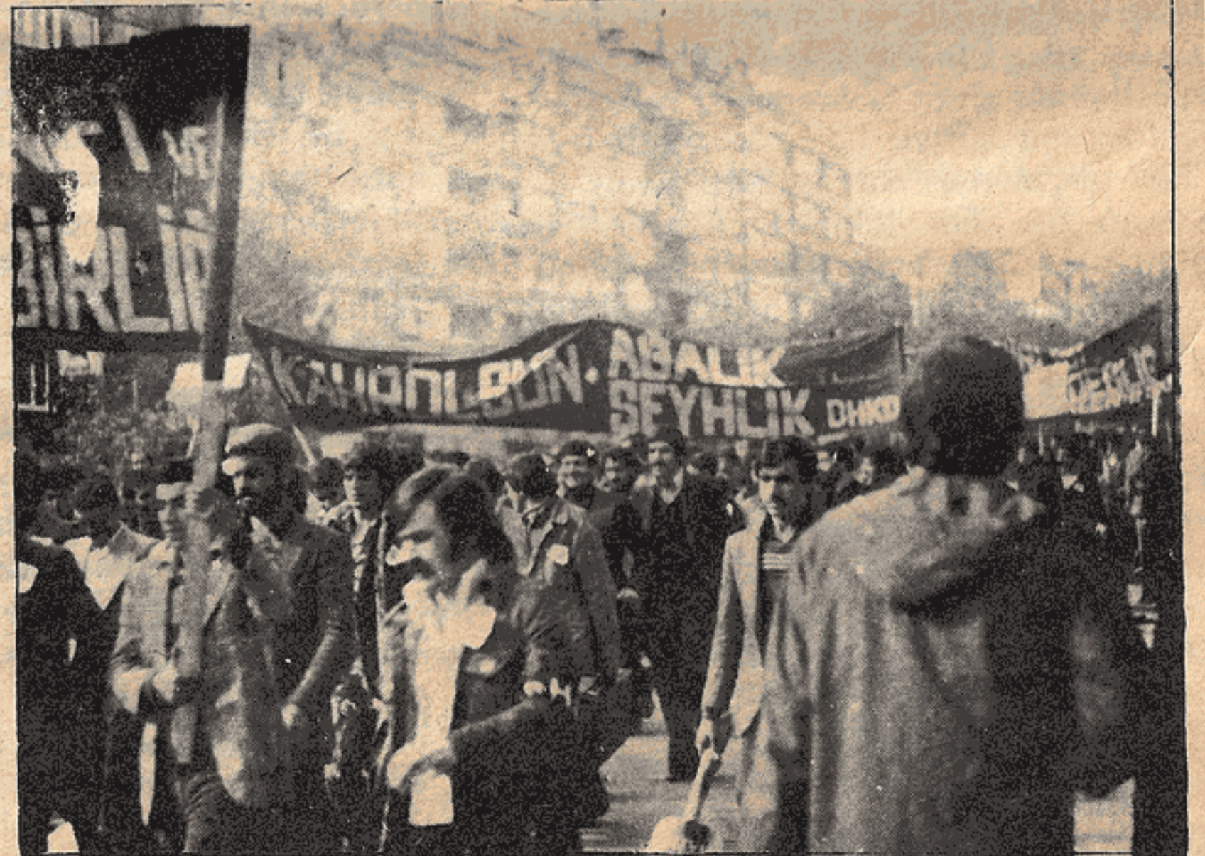
DHKD, 1 Mayıs yürüyüşünde...

Yönetim Kurulu kendi arasında görev bölümü yaparak başkanlığa Aydın Hasar, yazmanlığa Turgay Çakır, saymanlığa da Gani Cansever'i getirdiler.