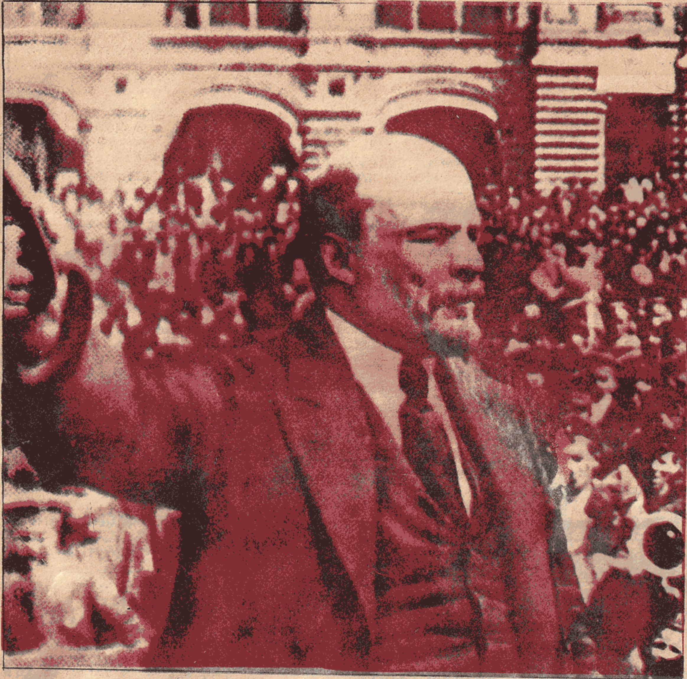
LENİN, 25 MART 1919'DA MOSKOVA'DA KİTLELERE HİTAP EDERKEN...

NOT: Bu yazı Sovyet NOVASTİ (APN) ajansından alınmıştır.