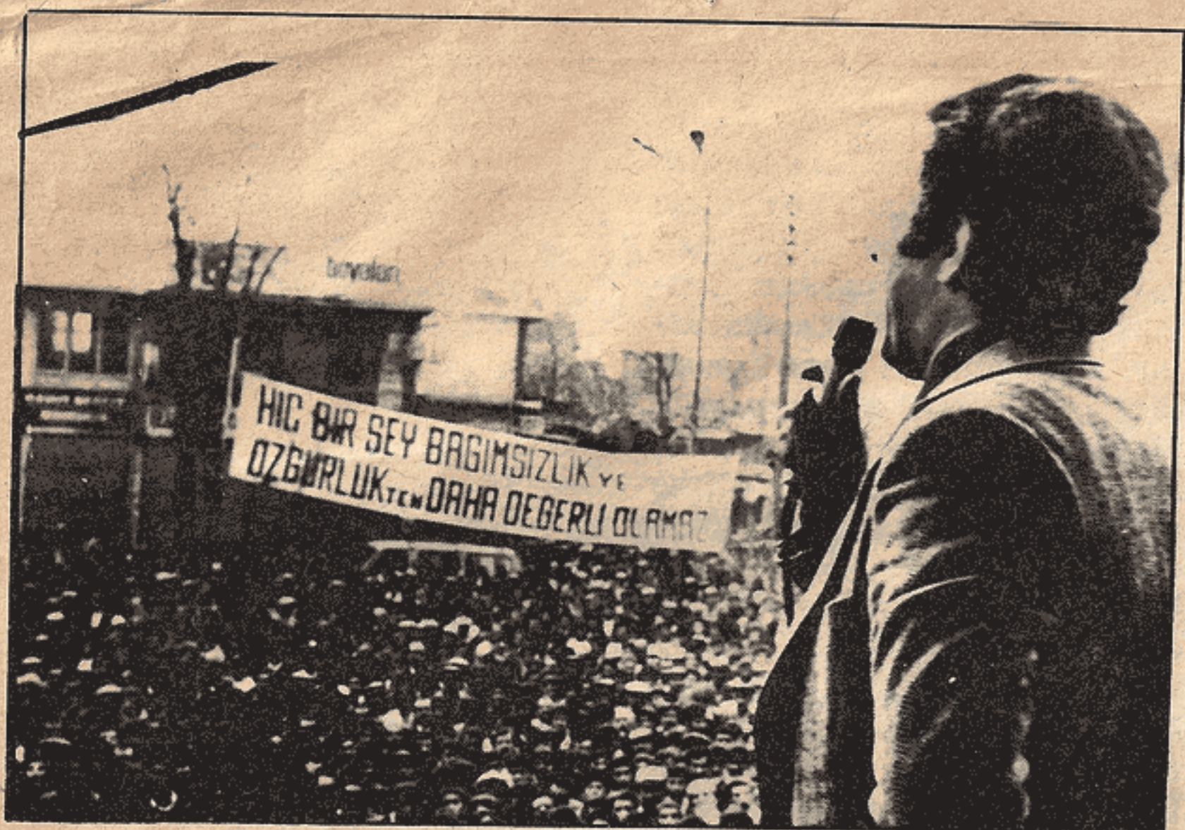
Mehti Zana 4 Aralık Mitinginde halka hitap ederken...