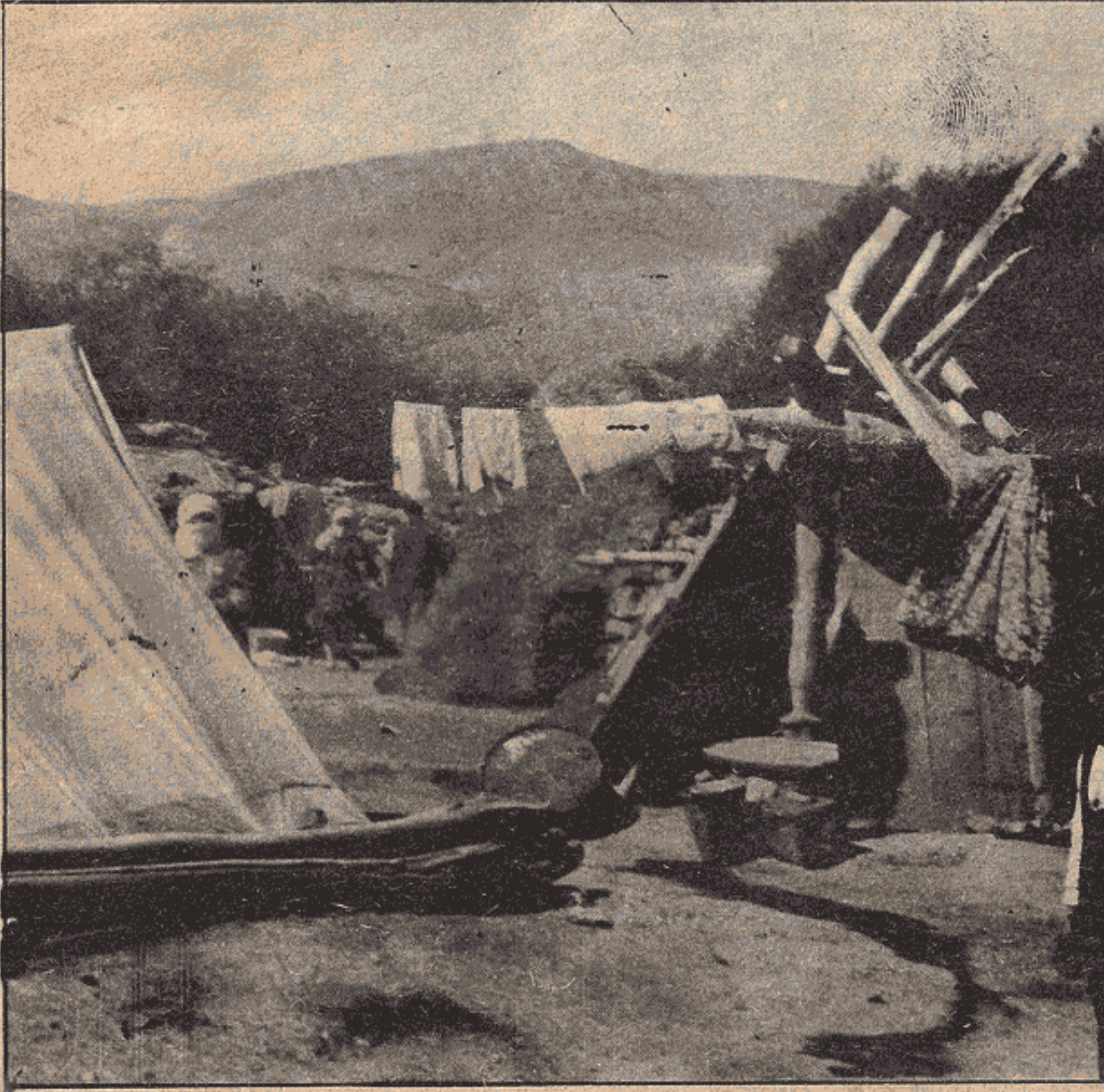
İkinci bir kışı da bu çadırlarda geçirecekler... Sıcaklığın (-30,40) dereceye düştüğü bir kış...

Van'da deprem felâketine uğrayan emekçi halkımız bu yıl da kışı açıkta geçiriyor. Gericiler bu yıl da onu yaraları ve acıları baş başa bıraktılar.