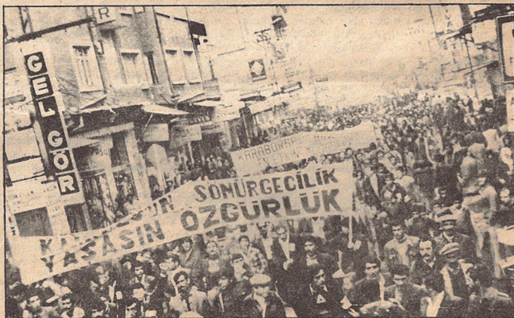
Kitleler 4 Aralık'ta "Kahrolsun-Sömürgecilik, Yaşasın Özgürlük!" diye haykırdılar...

Mehdi Zana, dört aya yakın bir süre Diyarbakır'ı ev-ev, kahve-kahve dolayarak halkla birlikte oturdu, onların sorunlarını dile getirdi ve onlardan destek istedi. Zana'nın karşısında sermayedarlar ve feodallar vardı ve onlar yüz binleri, milyonları harcıyorlardı. Mehdi Zana ise para-pula değil, halkına güveniyordu.