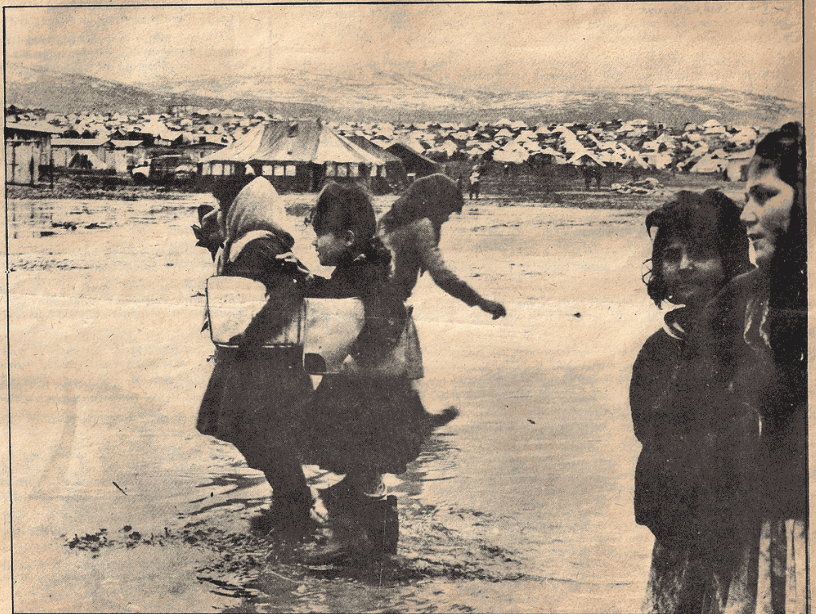
Bir Filistin kampında çocuklar okula gidiyorlar...

Filistin sorunu bakımından Orta-Doğu'da barışın sağlanması, hiç kuşkusuz, Carter ve uydularının önerdikleri biçimde değil -çünkü bu halde Filistin halkının özgürlüğü hiçe inecek ve kurtuluş mücadelesi de devam edecektir-, bu halkın kendi kaderini, hiç bir kayıt ve şarta bağlı olma'sızın belirlemesi ile mümkündür.