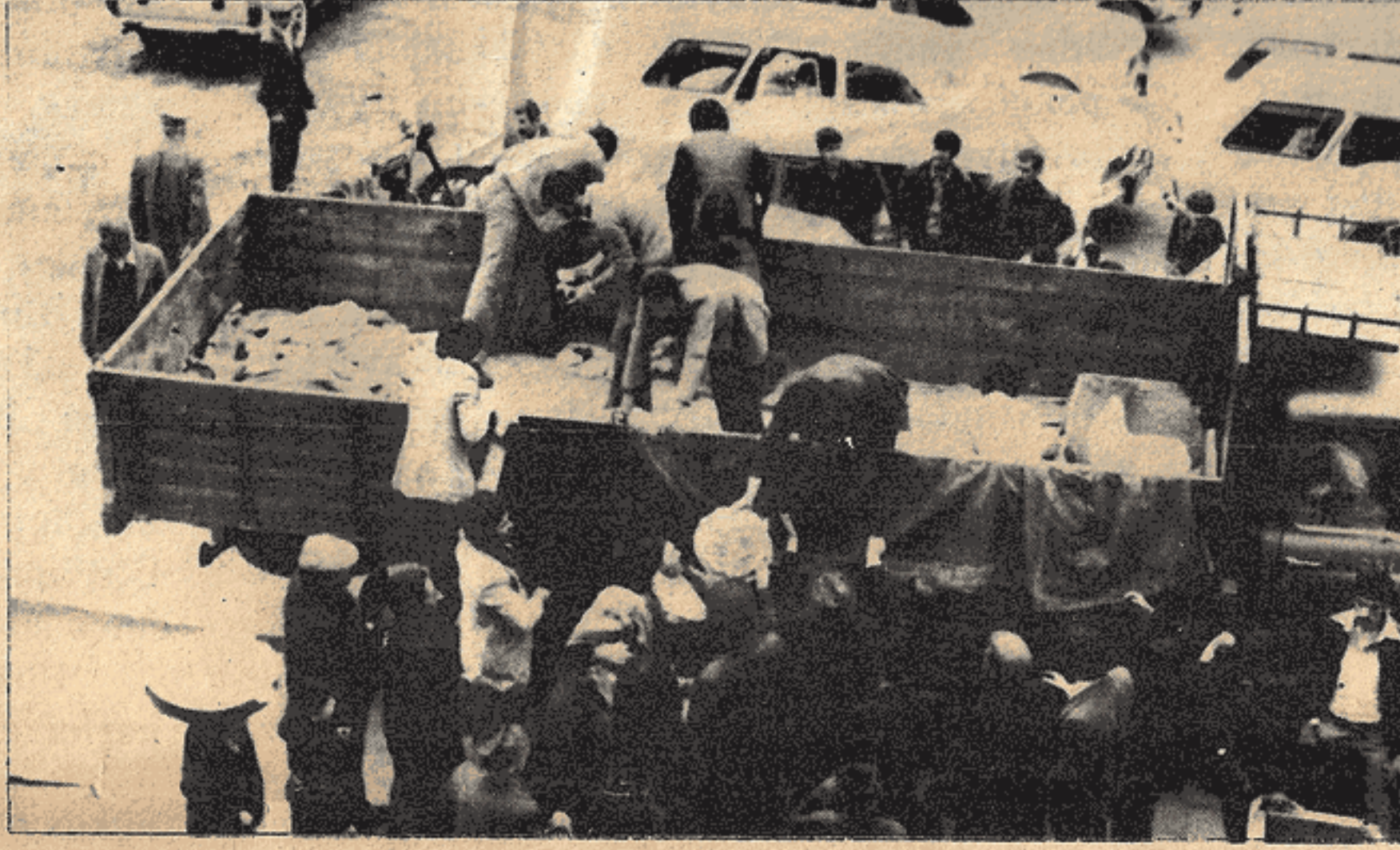
İHANET ŞEBEKELERİNE KARŞI DEVRİMCİ BELEDİYE, HALKI EKMEKSİZ BIRAKMADI....

"Halkın güvenliğini ve hayatı ihtiyaçlarını temin etmekle görevli bazı kurumlar, beledi-