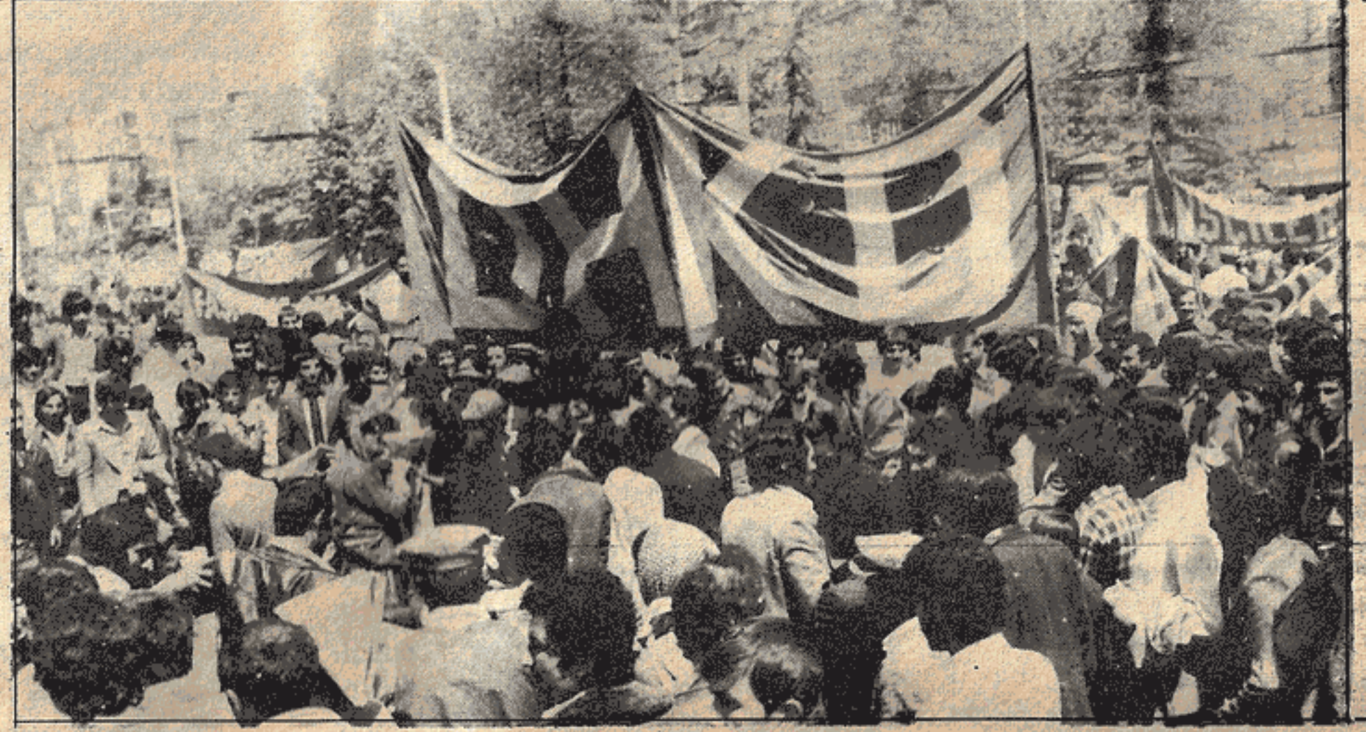
KÜRT GENÇLİĞİ, EMEKÇİLERİ YİĞİNSAL OLARAK 1 MAYIS TÖRENLERİNE KATILDILAR...

Burjuva basını bu bakımdan tam bir curcuna ve rezillik içinde: Kızıl bayraklar taşınmış; Marks'ın, Engels'in, Lenin'in resimleri taşınmış "TKP'ye Özgürlük", denmiş, "İşçilerin birliği, halkların kardeşliği", "Kahrolsun sömürgecilik", "Halklara özgürlük"